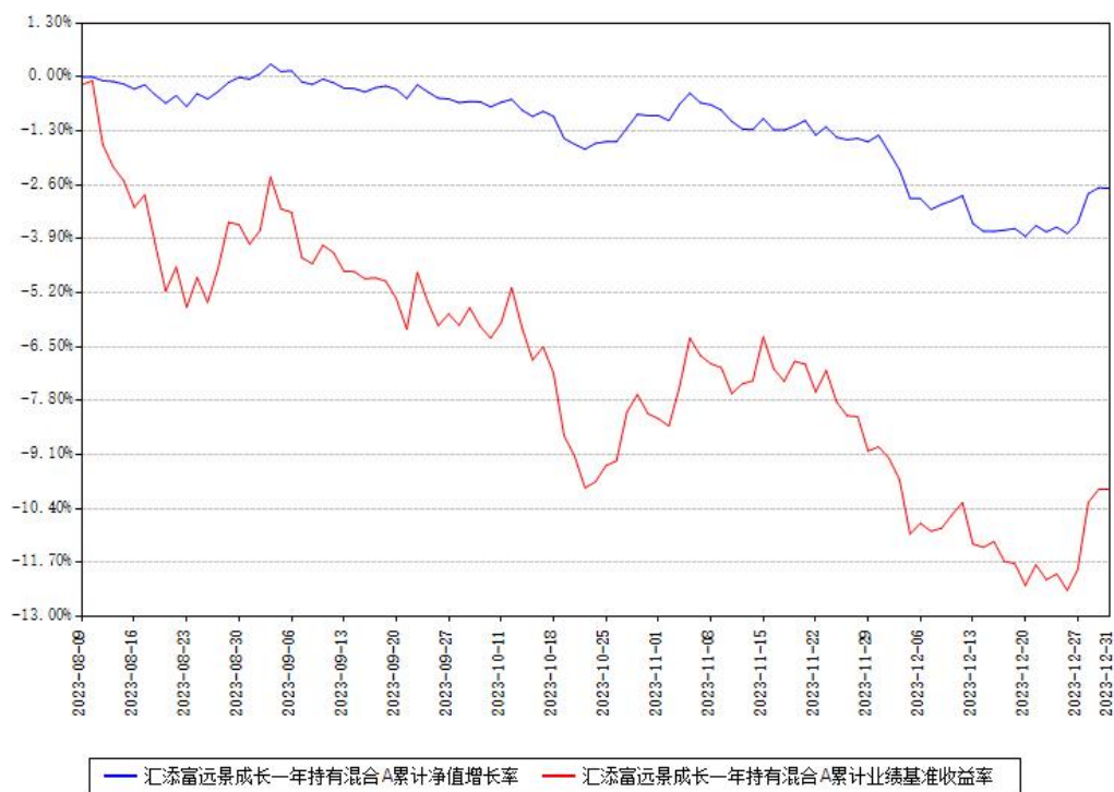
汇添富远景成长一年持有混合A累计净值增长率与同期业绩比较基准收益率对比图