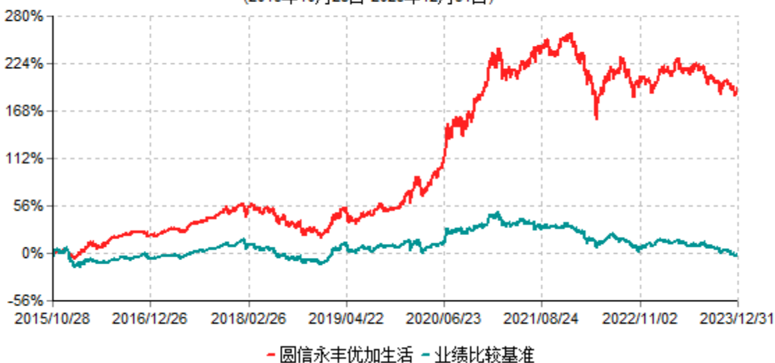
圆信永丰优加生活股票型证券投资基金累计净值增长率与业绩比较基准收益率历史走势对比图 (2015年10月28日-2023年12月31日)