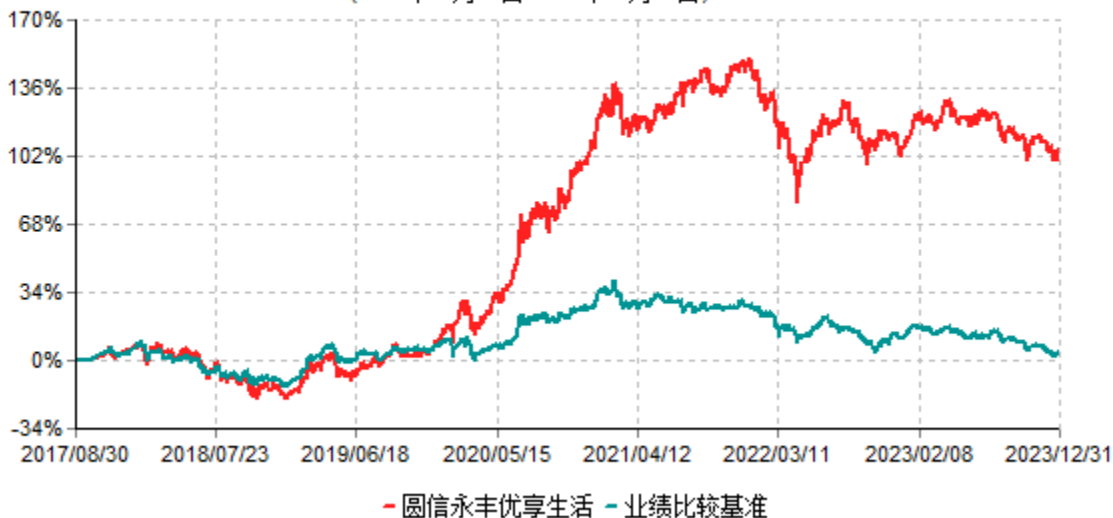
圆信永丰优享生活灵活配置混合型证券投资基金累计净值增长率与业绩比较基准收益率历史 走势对比图 (2017年08月30日-2023年12月31日)