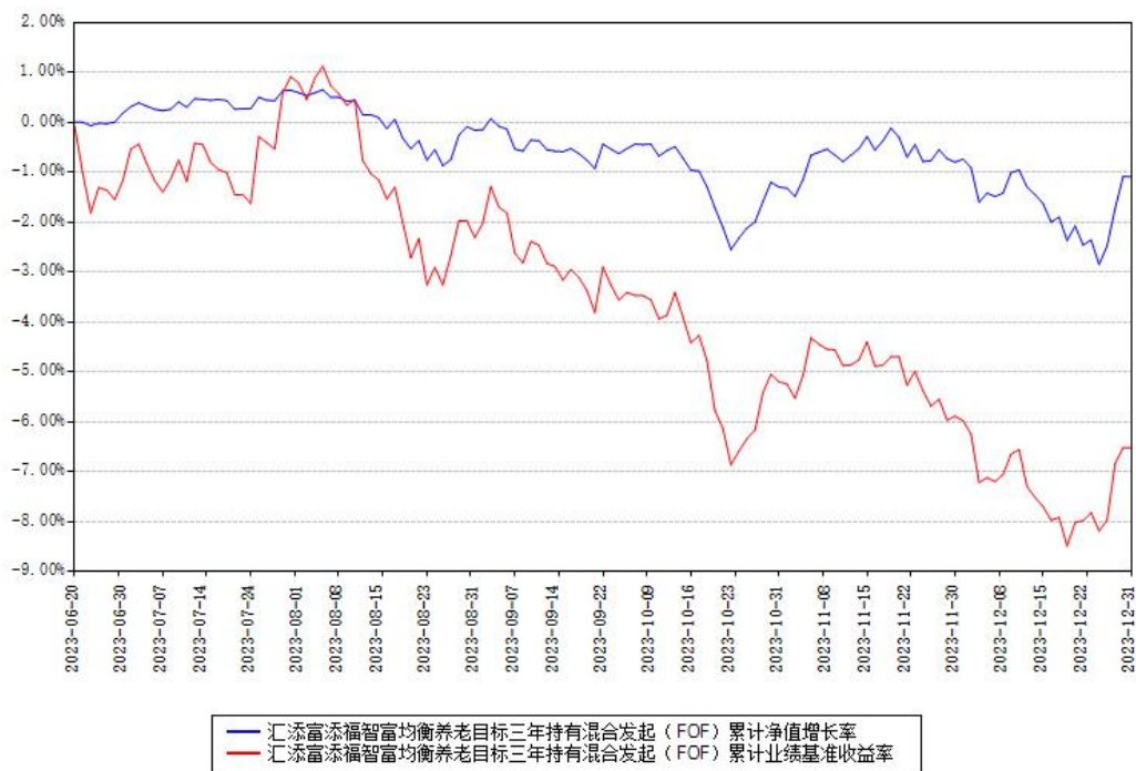
汇添富添福智富均衡养老目标三年持有混合发起（FOF）累计净值增长率与同期业绩基准收益率对比图

注：本《基金合同》生效之日为 2023 年 06 月 20 日，截至本报告期末，基金成立未满一年。