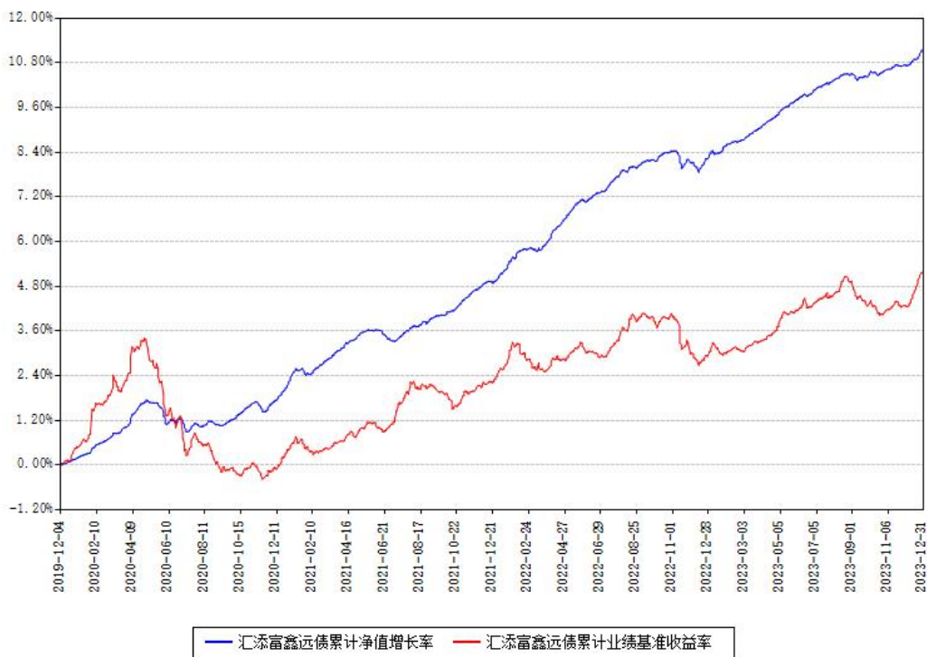
汇添富鑫远债累计净值增长率与同期业绩基准收益率对比图

注：本基金建仓期为本《基金合同》生效之日（2019年12月04日）起6个月，建仓期结束时各项资产配置比例符合合同约定。