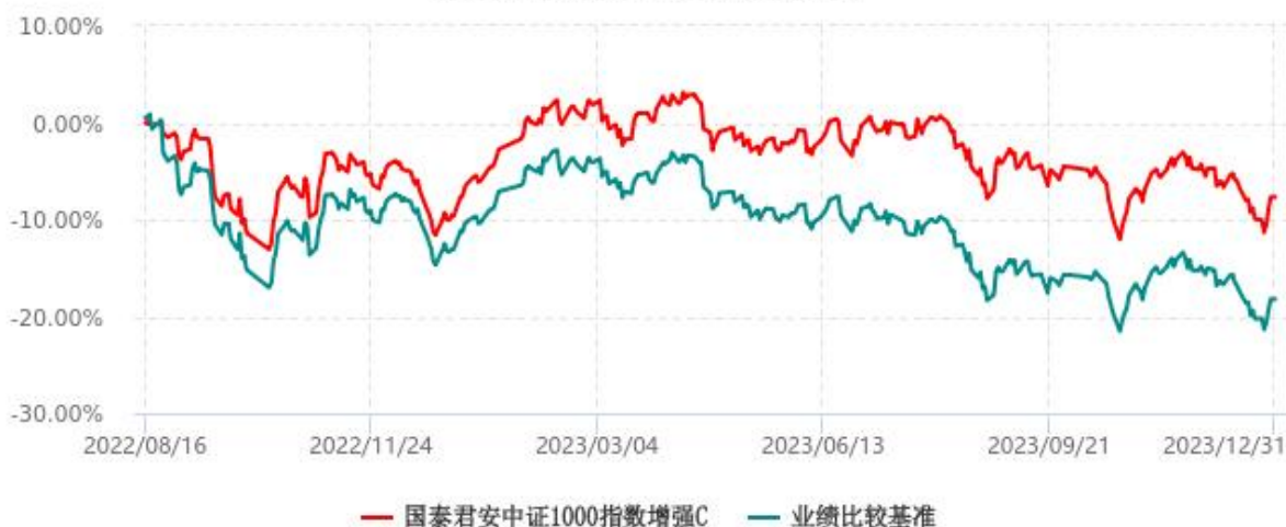
国泰君安中证1000指数增强C累计净值增长率与业绩比较基准收益率历史走势对比图 (2022年08月16日-2023年12月31日)

注：按基金合同和招募说明书的约定，本基金的建仓期为六个月，建仓期结束时各项资产配置比例符合基金合同的有关约定。