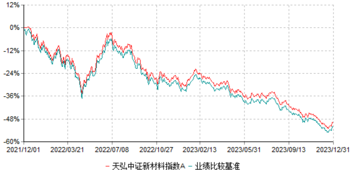
天弘中证新材料指数A累计净值增长率与业绩比较基准收益率历史走势对比图 (2021年12月01日-2023年12月31日)