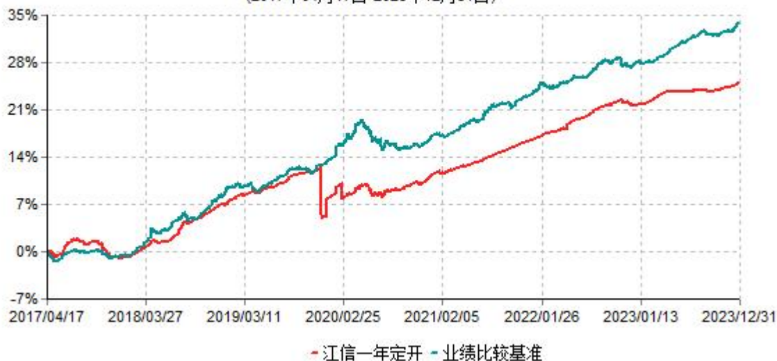
江信一年定期开放债券型证券投资基金累计净值增长率与业绩比较基准收益率历史走势对比图 (2017年04月17日-2023年12月31日)