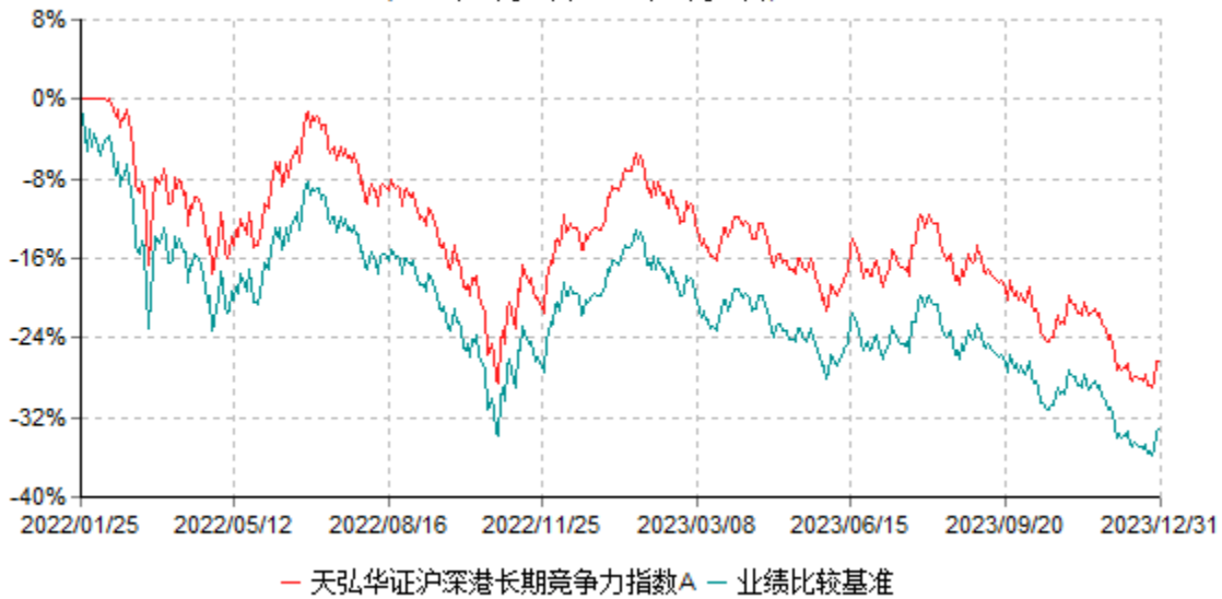
天弘华证沪深港长期竞争力指数A累计净值增长率与业绩比较基准收益率历史走势对比图 (2022年01月25日-2023年12月31日)