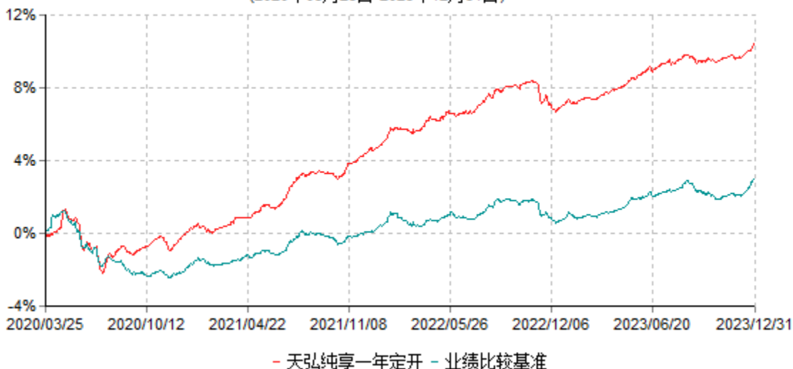
天弘纯享一年定期开放债券型发起式证券投资基金累计净值增长率与业绩比较基准收益率历史走势对比图 (2020年03月25日-2023年12月31日)