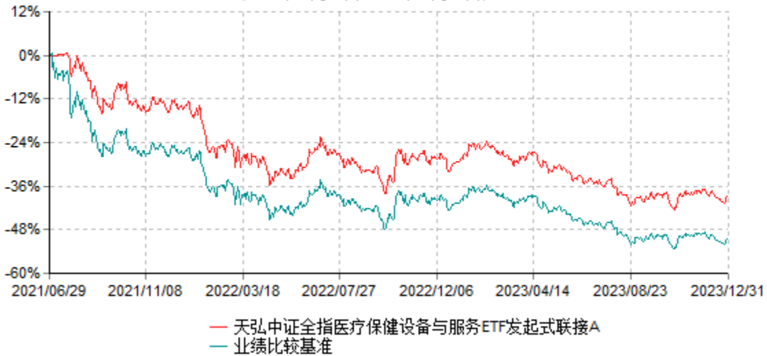
天弘中证全指医疗保健设备与服务ETF发起式联接A累计净值增长率与业绩比较基准收益率历史走势对比图 (2021年06月29日-2023年12月31日)