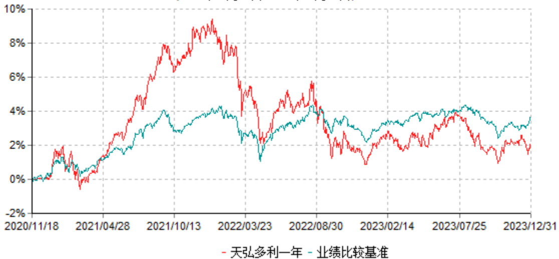
天弘多利一年定期开放混合型证券投资基金累计净值增长率与业绩比较基准收益率历史走势对比图 (2020年11月18日-2023年12月31日)