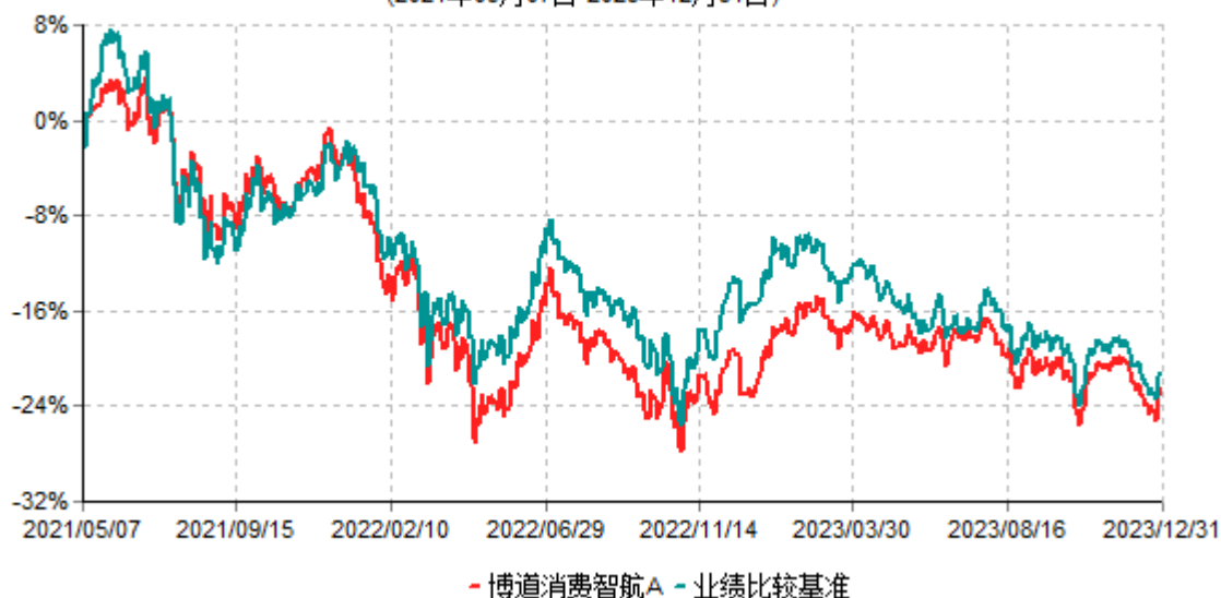
博道消费智航A累计净值增长率与业绩比较基准收益率历史走势对比图 (2021年05月07日-2023年12月31日)

注：本基金建仓期为自基金合同生效日起的6个月。截至建仓期结束，本基金各项资产配置比例符合基金合同及招募说明书有关投资比例的约定。