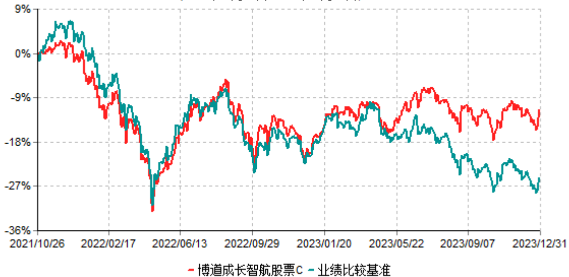
博道成长智航股票C累计净值增长率与业绩比较基准收益率历史走势对比图 (2021年10月26日-2023年12月31日)

注：本基金建仓期为自基金合同生效日起的6个月。截至建仓期结束，本基金各项资产配置比例符合基金合同及招募说明书有关投资比例的约定。