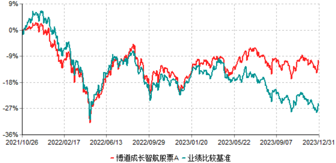
博道成长智航股票A累计净值增长率与业绩比较基准收益率历史走势对比图 (2021年10月26日-2023年12月31日)

注：本基金建仓期为自基金合同生效日起的6个月。截至建仓期结束，本基金各项资产配置比例符合基金合同及招募说明书有关投资比例的约定。