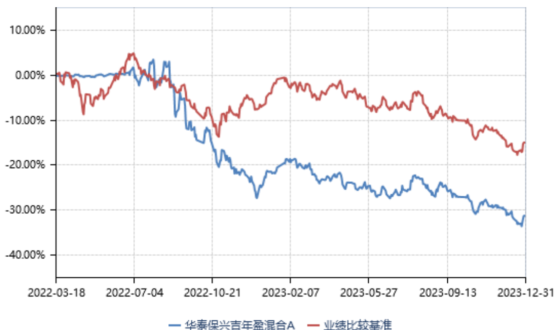
华泰保兴吉年盈混合A