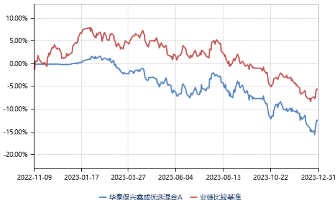
华泰保兴鑫成优选混合A