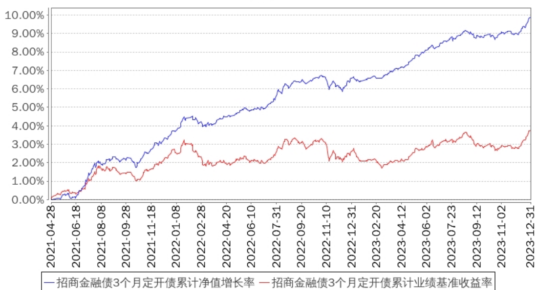
招商金融债3个月定开债累计净值增长率与同期业绩比较基准收益率的历史走势对比图