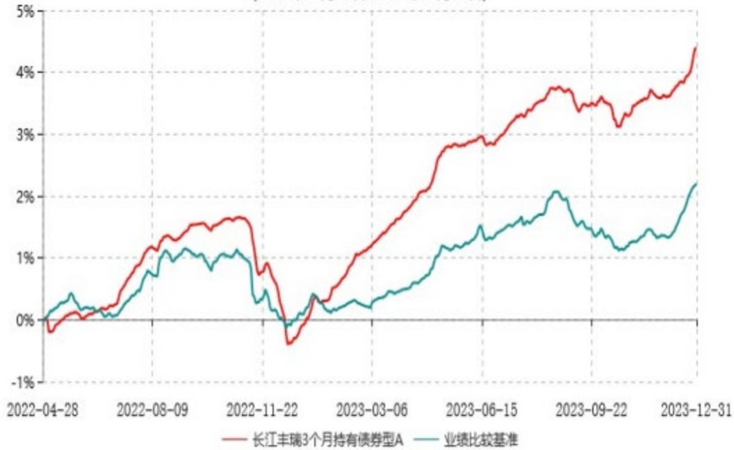
长江丰瑞3个月持有债券型C累计净值增长率与业绩比较基准收益率历史走势对比图