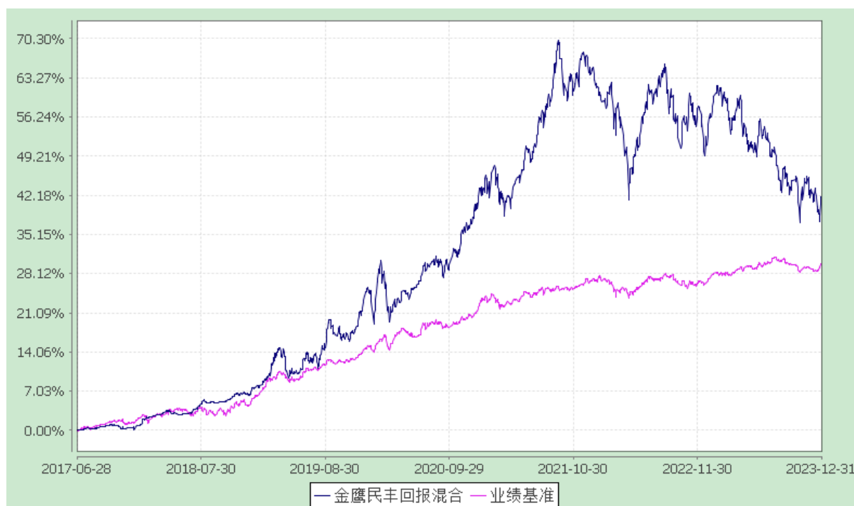
金鹰民丰回报定期开放混合型证券投资基金 份额累计净值增长率与业绩比较基准收益率历史走势对比图 (2017 年 6 月 28 日至 2023 年 12 月 31 日)