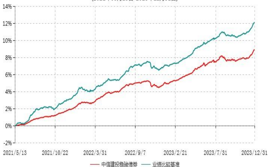
中信建投稳骏一年定期开放债券型发起式证券投资基金累计净值增长率与业绩比较基准收益率历史走势对比图 (2021年05月13日-2023年12月31日)