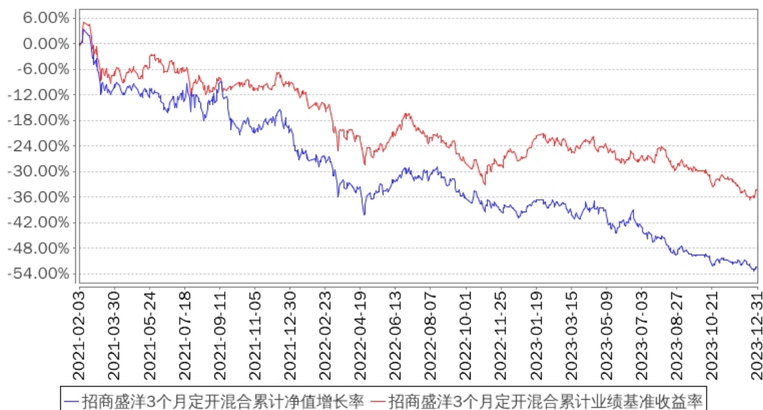
招商盛洋3个月定开混合累计净值增长率与同期业绩比较基准收益率的历史走势对比图