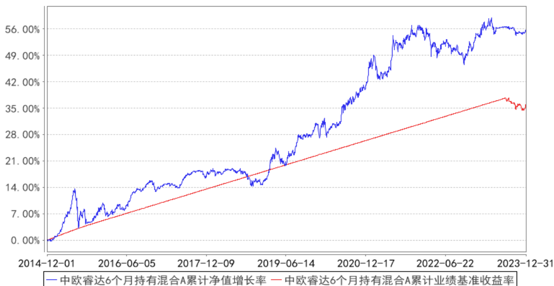
中欧睿达6个月持有混合A累计净值增长率与同期业绩比较基准收益率的历史走势对比图

注：2023 年 8 月 14 日起组合业绩比较基准变更为中债综合财富(总值)指数收益率*80%+沪深 300 指数收益率*17%+中证港股通综合指数(人民币)收益率*3%。