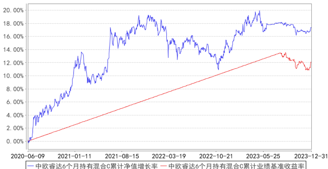
中欧睿达6个月持有混合C累计净值增长率与同期业绩比较基准收益率的历史走势对比图

注：2023 年 8 月 14 日起组合业绩比较基准变更为中债综合财富(总值)指数收益率*80%+沪深 300 指数收益率*17%+中证港股通综合指数(人民币)收益率*3%。