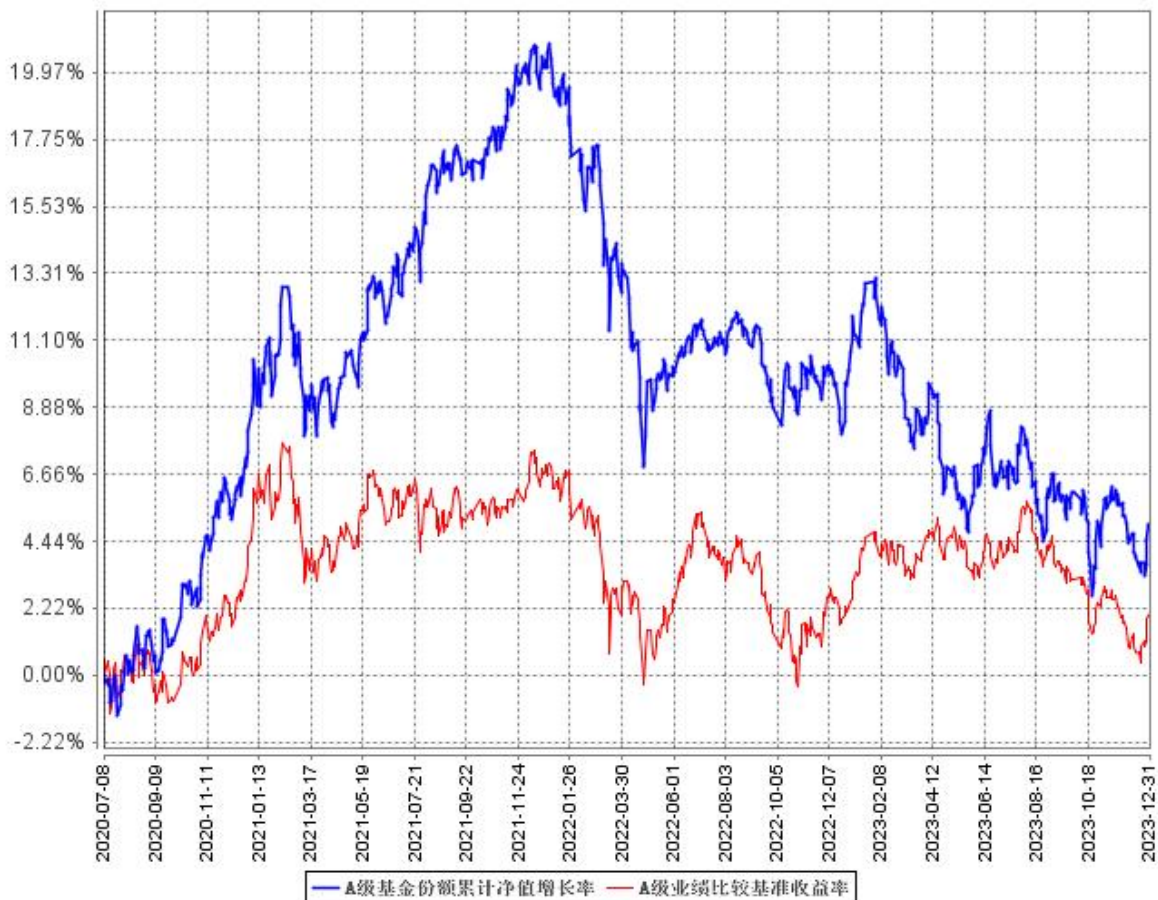
A级基金份额累计净值增长率与同期业绩比较基准收益率的历史走势对比图