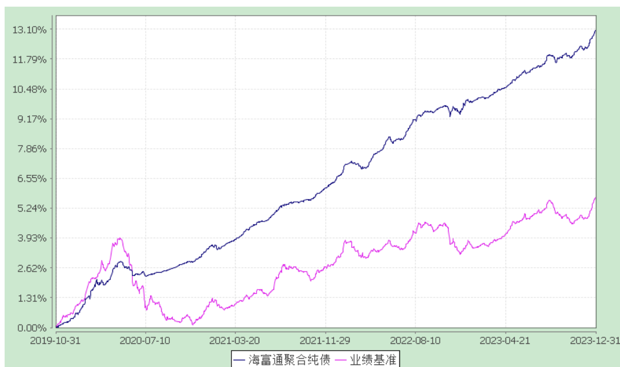
海富通聚合纯债债券型证券投资基金 份额累计净值增长率与业绩比较基准收益率的历史走势对比图 (2019 年 10 月 31 日至 2023 年 12 月 31 日)

注：本基金合同于 2019 年 10 月 31 日生效。按基金合同规定，本基金自基金合同生效起 6 个月内为建仓期。建仓期结束时本基金的各项投资比例已达到基金合同第十二部分（二）投资范围、（四）投资限制中规定的各项比例。