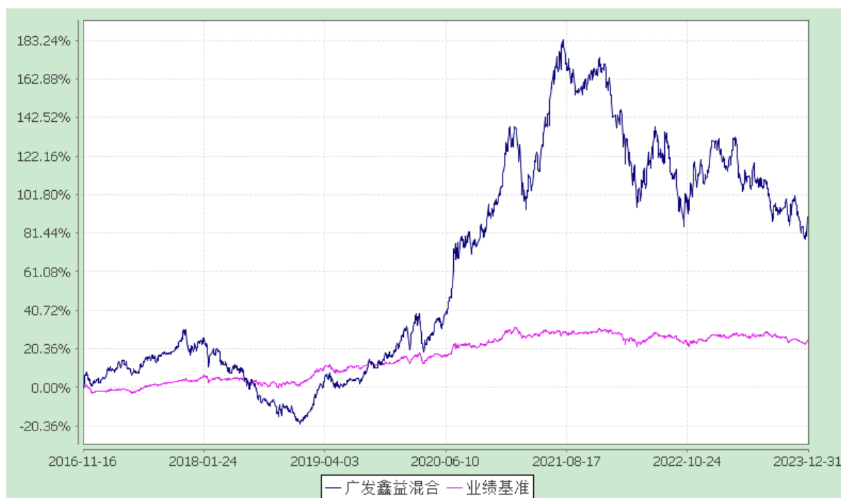
广发鑫益灵活配置混合型证券投资基金 份额累计净值增长率与业绩比较基准收益率的历史走势对比图 (2016年11月16日至2023年12月31日)