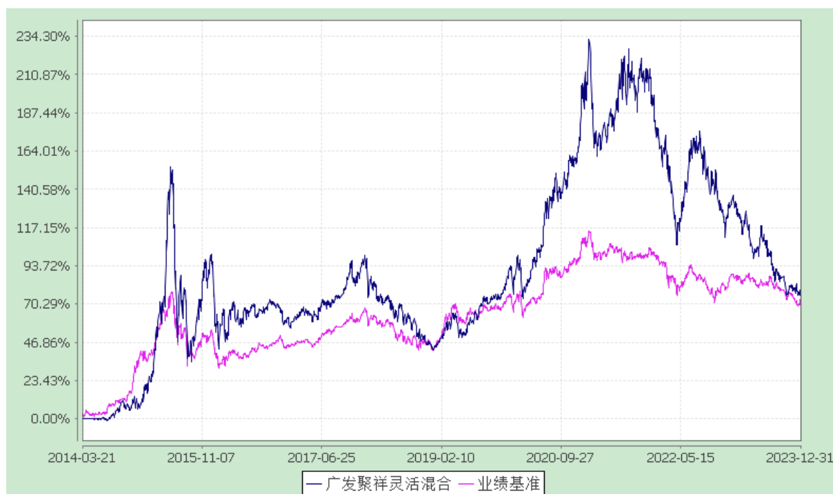
广发聚祥灵活配置混合型证券投资基金 份额累计净值增长率与业绩比较基准收益率的历史走势对比图 (2014 年 3 月 21 日至 2023 年 12 月 31 日)

注：本基金于 2014 年 3 月 21 日正式转型为广发聚祥灵活配置混合型证券投资基金。