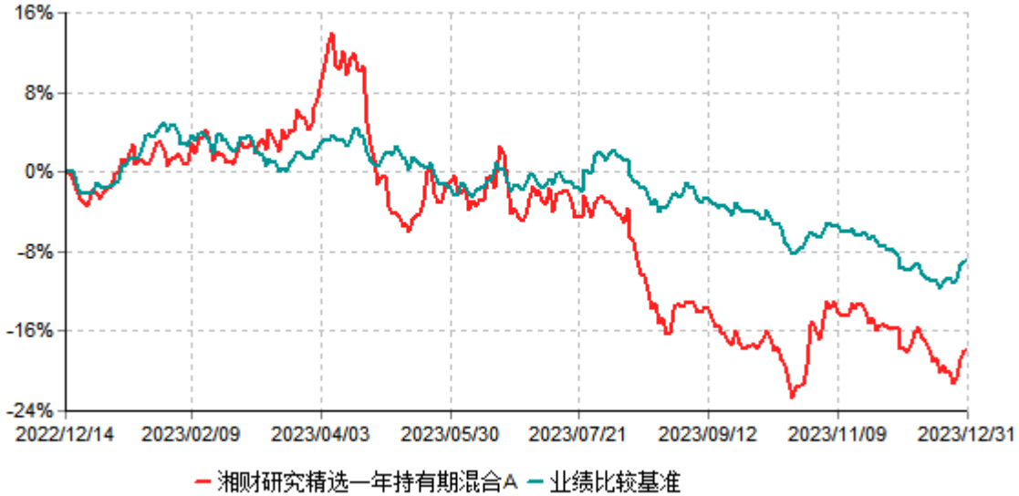
湘财研究精选一年持有期混合A累计净值增长率与业绩比较基准收益率历史走势对比图 (2022年12月14日-2023年12月31日)