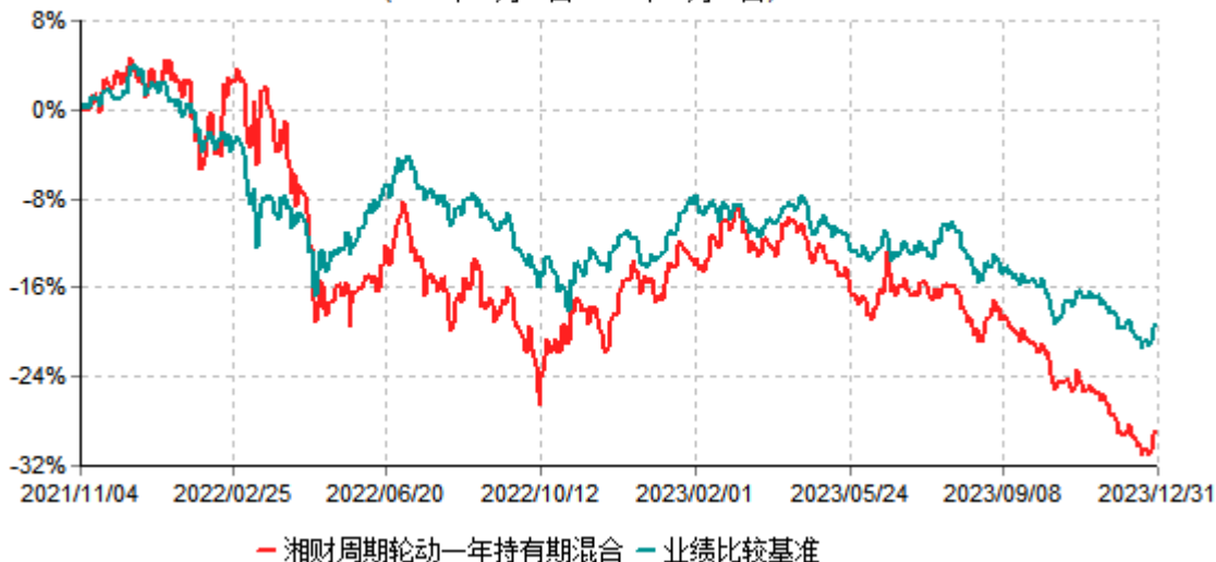
湘财周期轮动一年持有期混合型证券投资基金累计净值增长率与业绩比较基准收益率历史走势对比图 (2021年11月04日-2023年12月31日)