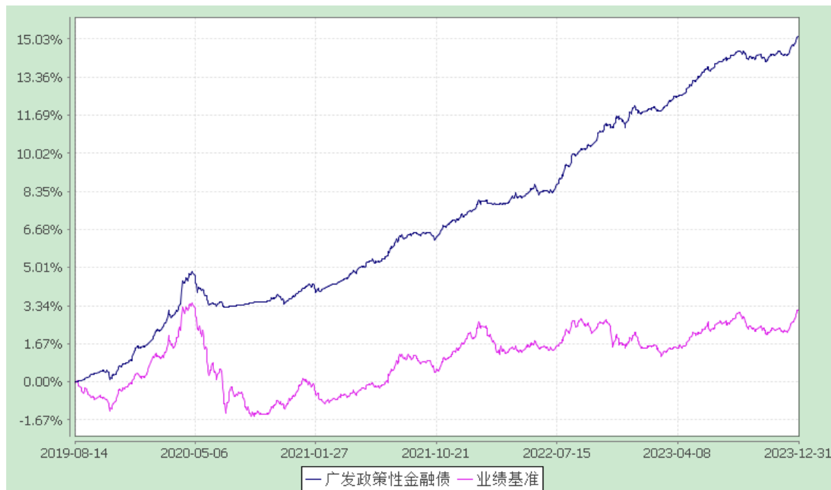
广发政策性金融债债券型证券投资基金 份额累计净值增长率与业绩比较基准收益率的历史走势对比图 (2019 年 8 月 14 日至 2023 年 12 月 31 日)