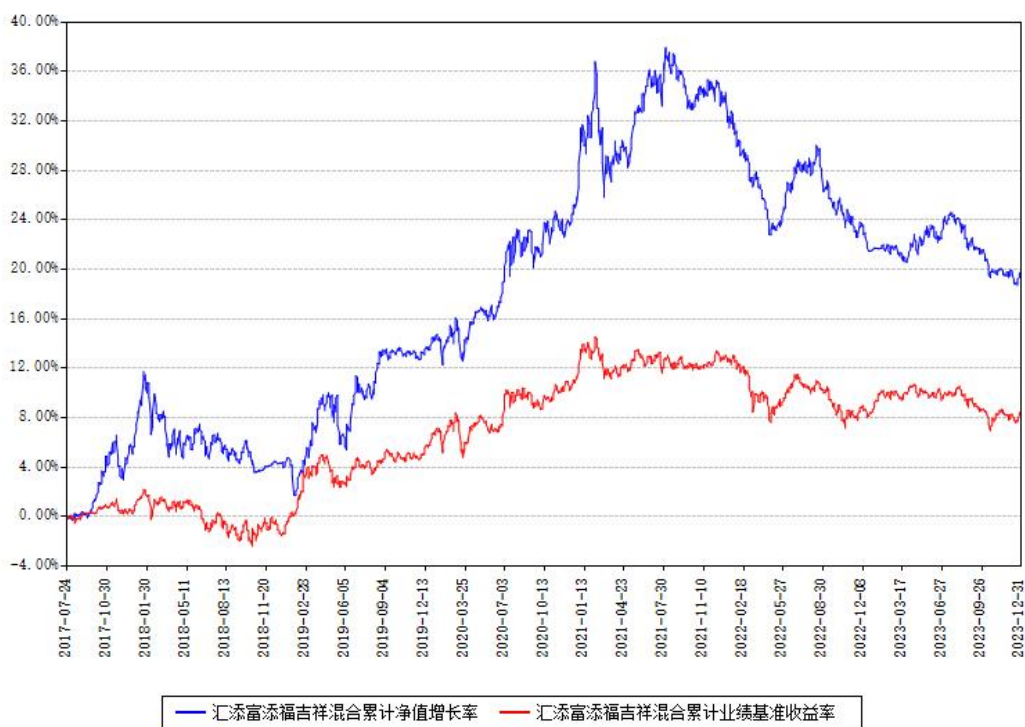
汇添富添福吉祥混合累计净值增长率与同期业绩基准收益率对比图

注：本基金建仓期为本《基金合同》生效之日（2017年07月24日）起6个月，建仓期结束时各项资产配置比例符合合同约定。