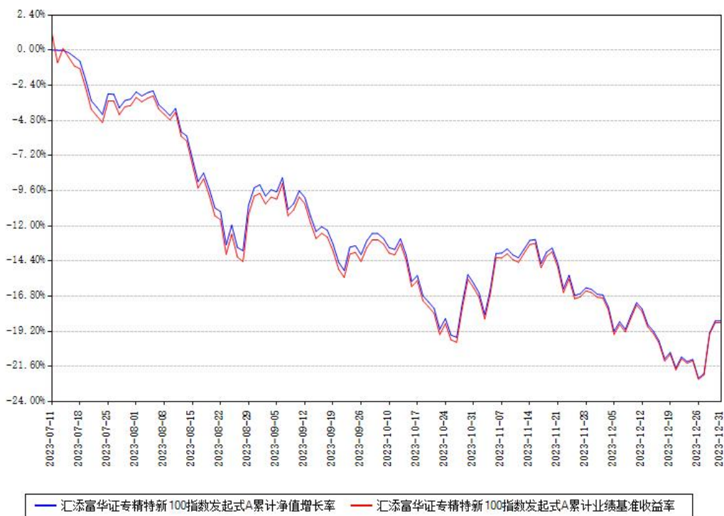
汇添富华证专精特新100指数发起式A累计净值增长率与同期业绩基准收益率对比图