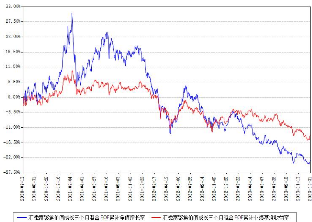
汇添富聚焦价值成长三个月混合 FOF 累计净值增长率与同期业绩基准收益率对比图

注：本基金建仓期为本《基金合同》生效之日（2020年07月13日）起6个月，建仓期结束时各项资产配置比例符合合同约定。