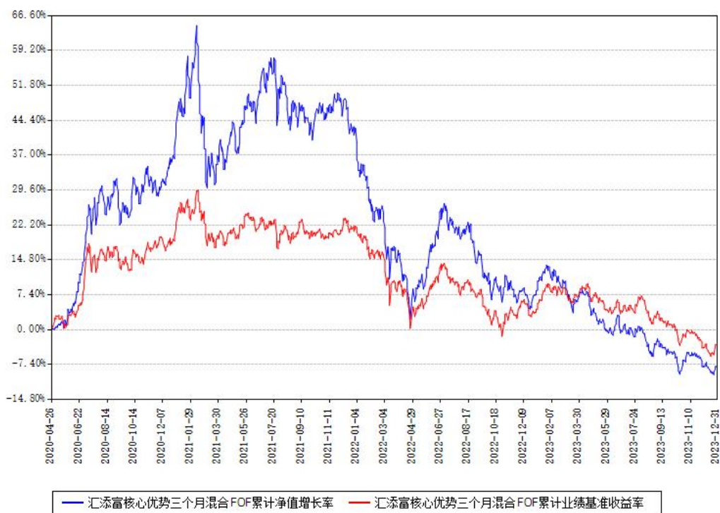
汇添富核心优势三个月混合FOF累计净值增长率与同期业绩基准收益率对比图

注：本基金建仓期为本《基金合同》生效之日（2020年04月26日）起6个月，建仓期结束时各项资产配置比例符合合同约定。