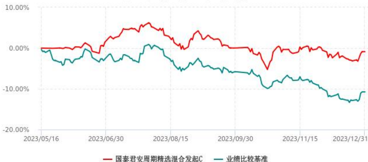
国泰君安周期精选混合发起C累计净值增长率与业绩比较基准收益率历史走势对比图 (2023年05月16日-2023年12月31日)

注：1、本基金于 2023 年 05 月 16 日成立，自合同生效日起至本报告期末不足一年。