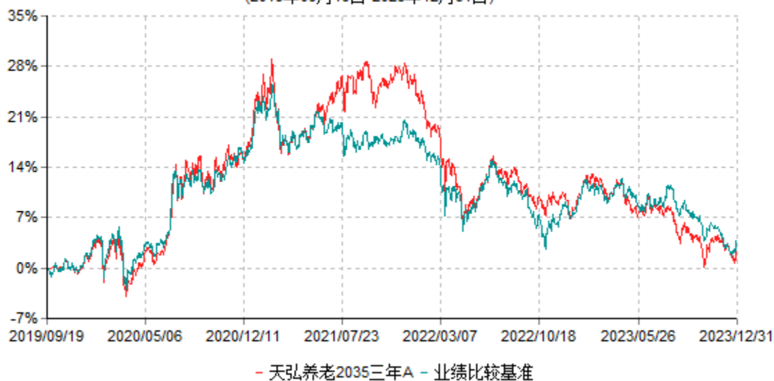
天弘养老2035三年A累计净值增长率与业绩比较基准收益率历史走势对比图 (2019年09月19日-2023年12月31日)