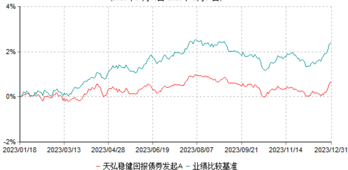
天弘稳健回报债券发起A累计净值增长率与业绩比较基准收益率历史走势对比图 (2023年01月18日-2023年12月31日)