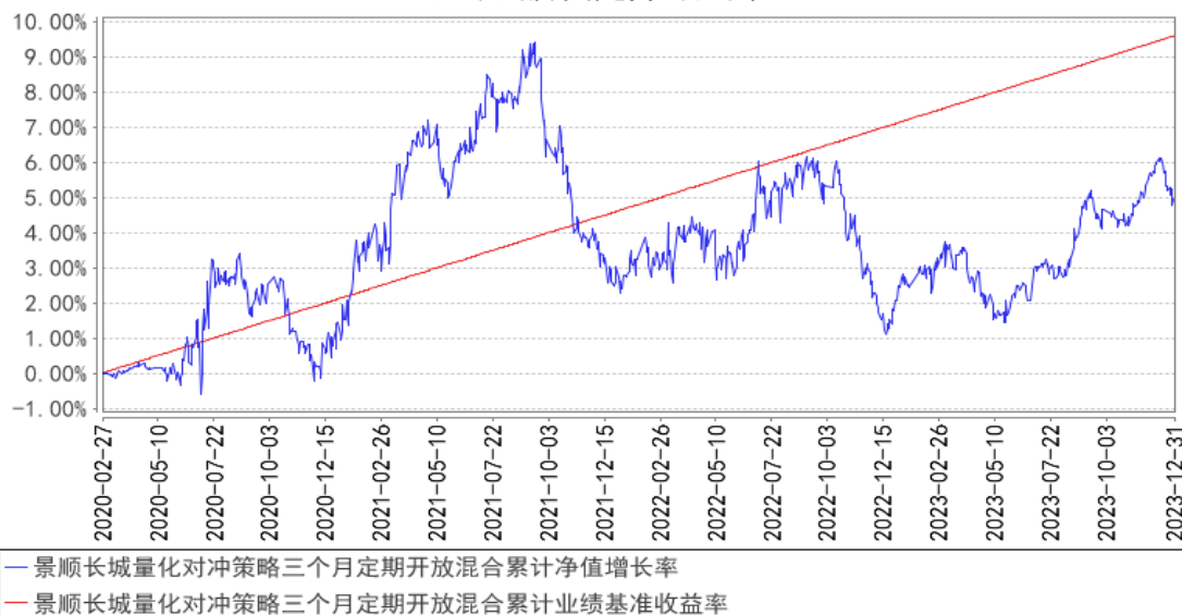
景顺长城量化对冲策略三个月定期开放混合累计净值增长率与同期业绩比较基准收益率的历史走势对比图