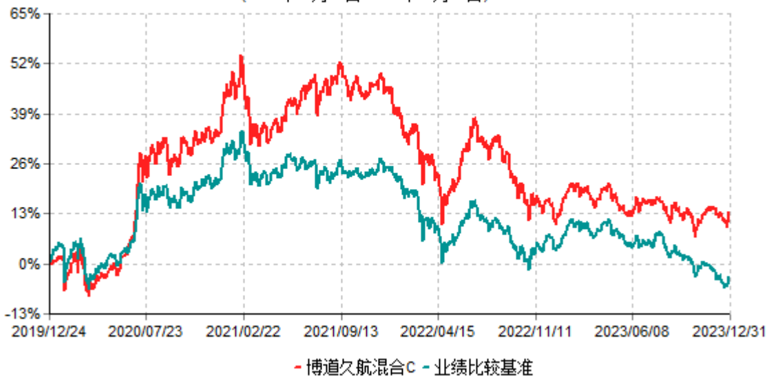
博道久航混合C累计净值增长率与业绩比较基准收益率历史走势对比图 (2019年12月24日-2023年12月31日)

注：本基金建仓期为自基金合同生效日起的6个月。截至建仓期结束，本基金各项资产配置比例符合基金合同及招募说明书有关投资比例的约定。