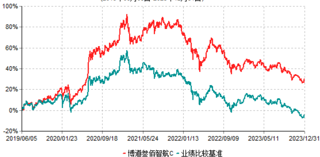
博道叁佰智航C累计净值增长率与业绩比较基准收益率历史走势对比图 (2019年06月05日-2023年12月31日)

注：本基金建仓期为自基金合同生效日起的6个月。截至建仓期结束，本基金各项资产配置比例符合基金合同及招募说明书有关投资比例的约定。