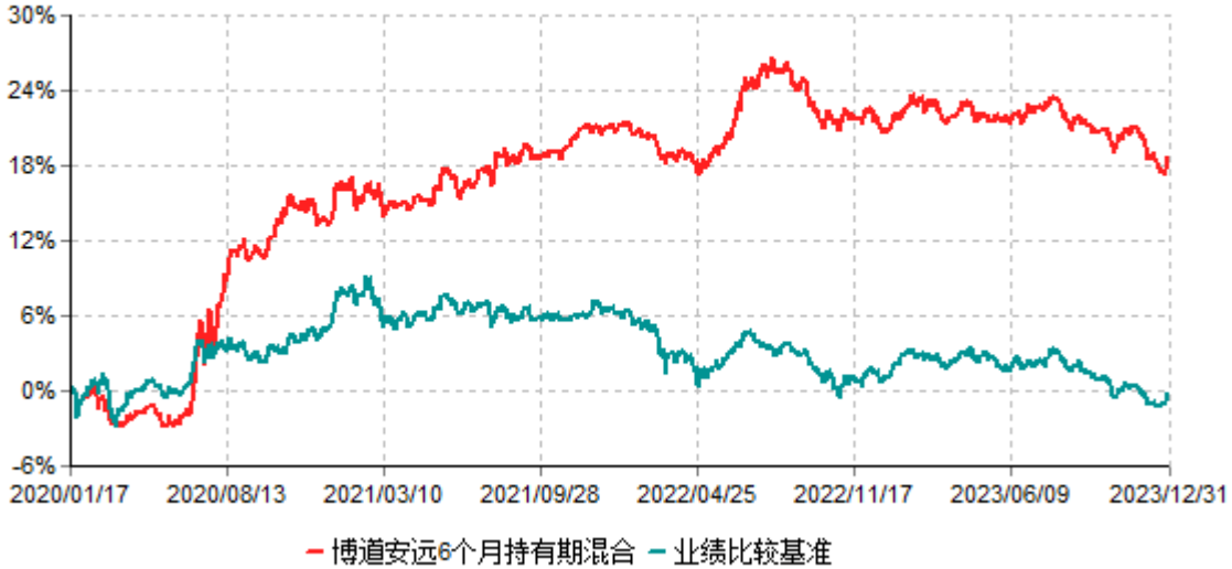
博道安远6个月持有期混合型证券投资基金累计净值增长率与业绩比较基准收益率历史走势 对比图 (2020年01月17日-2023年12月31日)

注：本基金建仓期为自基金合同生效日起的6个月。截至建仓期结束，本基金各项资产配置比例符合基金合同及招募说明书有关投资比例的约定。