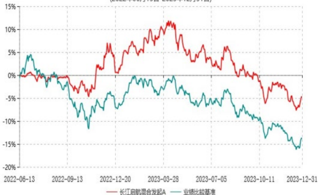
长江启航混合发起C累计净值增长率与业绩比较基准收益率历史走势对比图