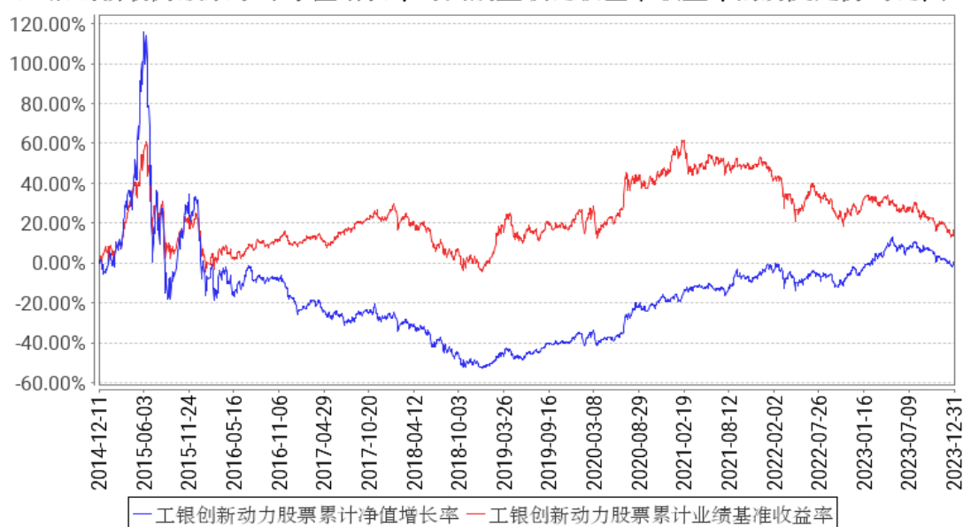
工银创新动力股票累计净值增长率与同期业绩比较基准收益率的历史走势对比图