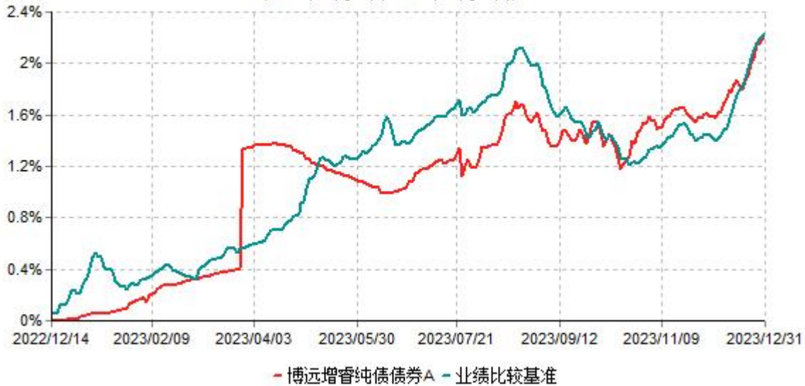
博远增睿纯债债券A累计净值增长率与业绩比较基准收益率历史走势对比图 (2022年12月14日-2023年12月31日)