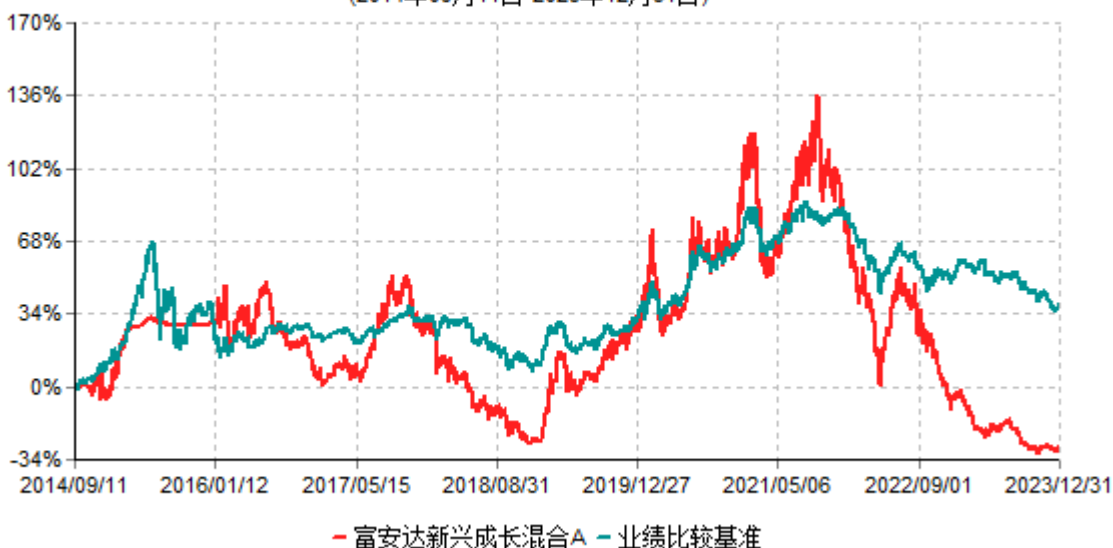
富安达新兴成长混合A累计净值增长率与业绩比较基准收益率历史走势对比图 (2014年09月11日-2023年12月31日)