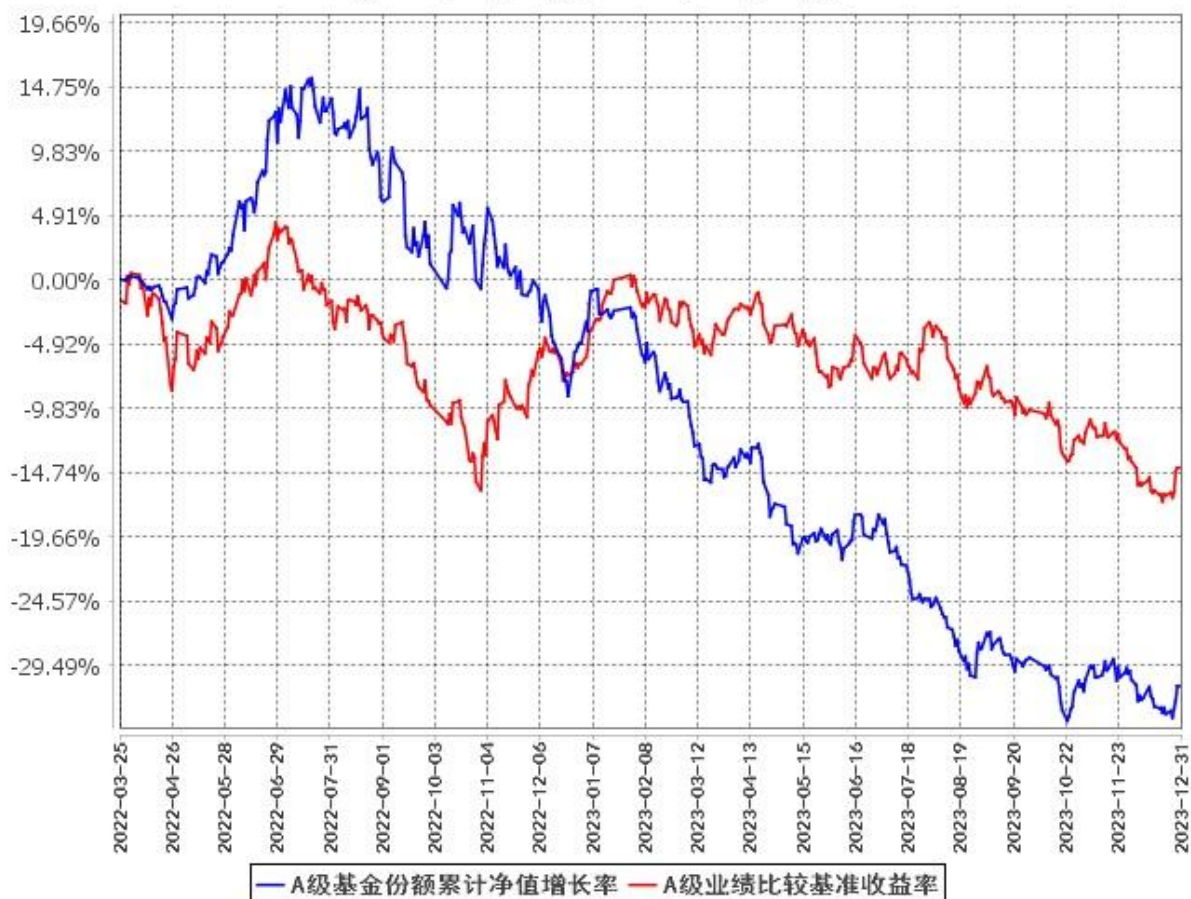
A级基金份额累计净值增长率与同期业绩比较基准收益率的历史走势对比图 (2022年3月25日至2023年12月31日)