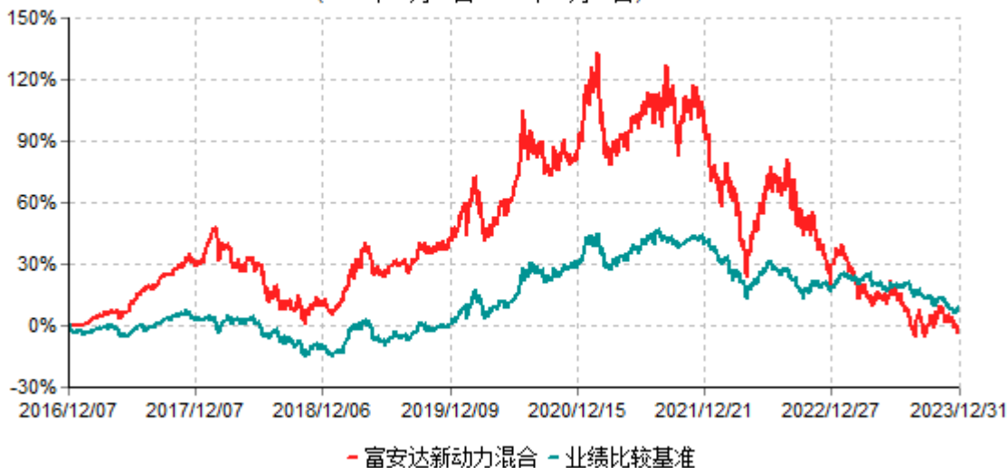
富安达新动力灵活配置混合型证券投资基金累计净值增长率与业绩比较基准收益率历史走势 对比图 (2016年12月07日-2023年12月31日)