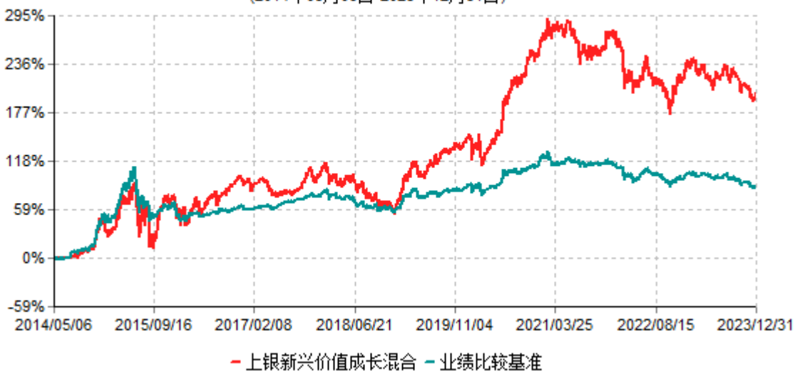
上银新兴价值成长混合型证券投资基金累计净值增长率与业绩比较基准收益率历史走势对比图 (2014年05月06日-2023年12月31日)

注：1、本基金合同生效日为2014年5月6日，自基金合同生效日起6个月内为建仓期，建仓期结束时资产配置比例符合基金合同约定。