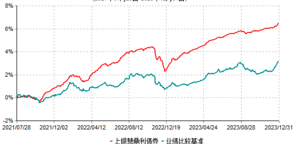
上银慧鼎利债券型证券投资基金累计净值增长率与业绩比较基准收益率历史走势对比图 (2021年07月28日-2023年12月31日)

注：本基金合同生效日为2021年7月28日，自基金合同生效日起6个月内为建仓期，建仓期结束时各项资产配置比例符合基金合同约定。