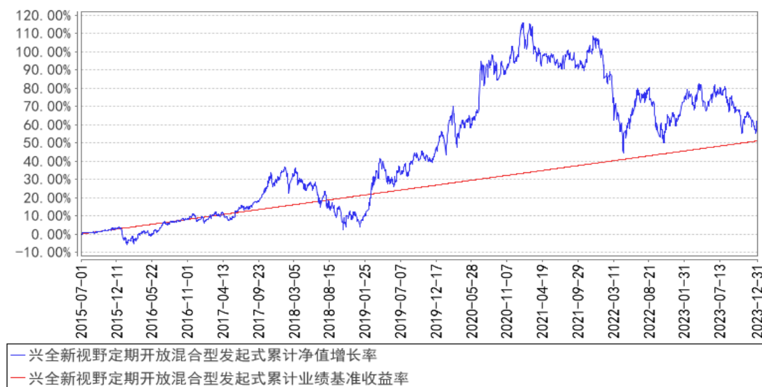
兴全新视野定期开放混合型发起式累计净值增长率与同期业绩比较基准收益率的历史走势对比图