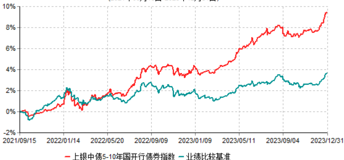
上银中债5-10年国开行债券指数证券投资基金累计净值增长率与业绩比较基准收益率历史走势对比图 (2021年09月15日-2023年12月31日)

注：本基金合同生效日为2021年9月15日，自基金合同生效日起6个月内为建仓期，建仓期结束时各项资产配置比例符合基金合同约定。